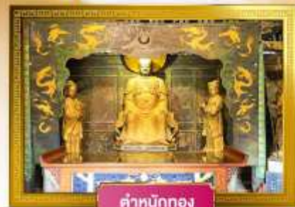
ตำหนักทอง