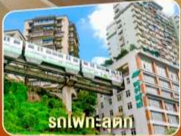
รถไฟทะเลดัก