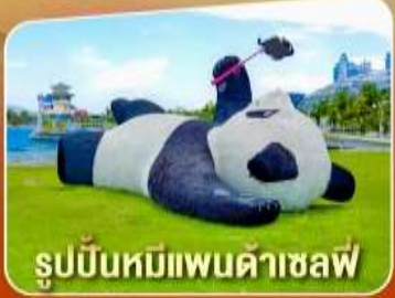
รูปปั้นหมีแพนด้าซาล์ว