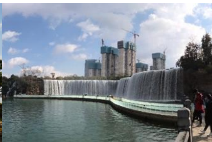
สวนน้ำตก Kunming Waterfall Park