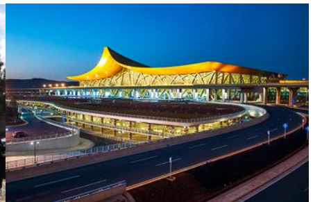
สนามบินเบียวคุนหมิง