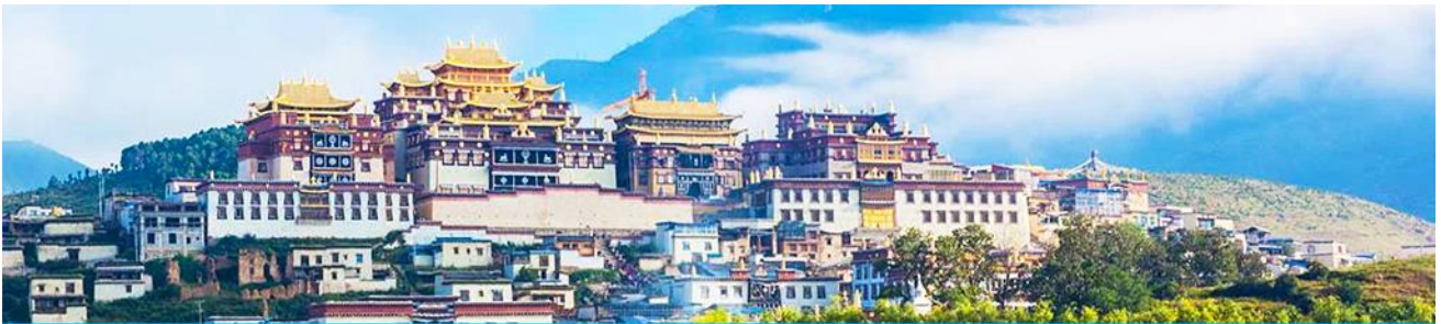
เมืองโบราณแชงกรีล่า

จากนั้นนำท่านชม หมู่บ้านซีโจวหรือหมู่บ้านชาวไป่ ชนพื้นเมืองที่สำคัญของเมือง ชมการแสดงของชนชาติป๋ายพร้อมชิมชาสามแก้ว เพื่อรำลึกถึงวิถีชีวิตและการเกิดมาเป็นมนุษย์ของตนเอง ซึ่งถือเป็นเอกลักษณ์ของชนชาวไป่ ที่หาดูได้ยาก