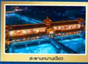
สะพานเทียนเฉียว