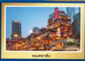
ตองชยาตั้ง