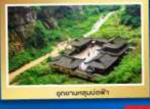
อุทยานนกยูงน้อยฟ้า