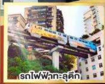
รถไฟฟ้ากะลุติง