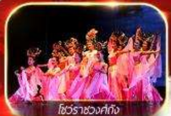
โชว์ราชวงศ์ถัง

สัมผัสความยิ่งใหญ่อลังการกองทัพจีนสี่ฮ่องเต้ นั่งรถไฟความเร็วสูงทะลุเมืองโบราณ ย้อนตำนานประวัติศาสตร์จีน