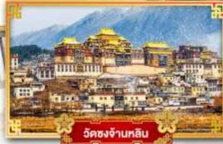
วัดชงจ้านหลิน