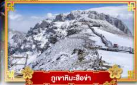
ภูเขาหิมะสีอ้อ