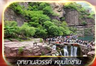
อุทยานสวรรค์ หยูนโก่ซาน