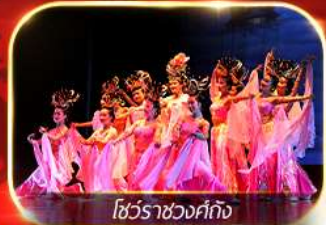
โชว์ราชวงศ์ถัง

สัมผัสความยิ่งใหญ่อลังการกองทัพจีนสี่ฮ่องเต้ นั่งรถไฟความเร็วสูงทะลุเมืองโบราณ ย้อนตำนานประวัติศาสตร์จีน