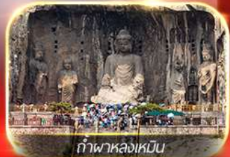
ถ้ำพาลงเหมิน