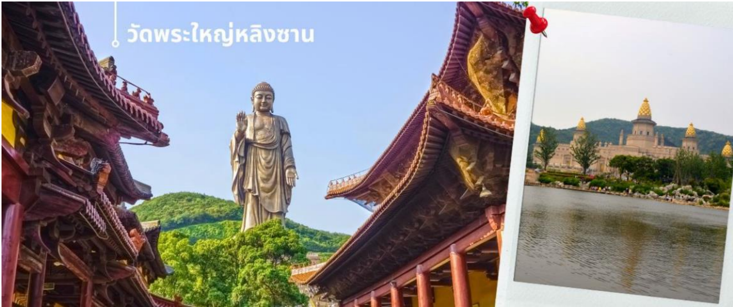
วัดพระใหญ่หลิงชาน

จีนและไต้หวัน เป็นพระพุทธรูปปางยืนของพระอมิตาภพุทธะแบบสัมฤทธิ์กลางแจ้ง หนักกว่า 7,000 เมตริกตัน สร้างเสร็จเมื่อปลายปี ค.ศ. 1996 มีความสูงกว่า 88 เมตร (289 ฟุต) รวมฐานบัว 9 เมตร นักท่องเที่ยวทั้งชาวจีนและชาวต่างชาตินิยมมาขอพรเพื่อความสิริมงคลและความสำเร็จในหน้าที่การงาน การเดินทางให้แคล้วคลาดปลอดภัย โดยการกราบและลูบที่เท้าทำน ซึ่งภายในพระพุทธรูปยังมีพิพิธภัณฑ์ชีวประวัติของท่านให้ได้เรียนรู้อีกด้วย ภายในประกอบไปด้วย ตำหนักผานกง หรือ ศาลาผานกง ตั้งอยู่ที่ริมทะเลสาบไท่หู ทางตะวันออกของพุทธอุทยาน ก่อสร้างราวปี 2006 บนเนื้อที่กว่า 7 หมื่นตารางเมตร เป็นที่รวมของศิลปวัฒนธรรมอันหลากหลายของพุทธศาสนาในแต่ละนิกายและแต่ละประเทศได้อย่างงดงามลงตัว จนถูกเรียกขานว่าเป็น พิพิธภัณฑ์พุทธศิลป์ร่วมสมัยแห่งประเทศไทย เพราะเป็นที่รวมของพิพิธภัณฑ์ นิทรรศการ โรงละคร คอนเสิร์ต และงานพุทธศิลป์มากมาย ที่น่าตื่นตาตื่นใจ