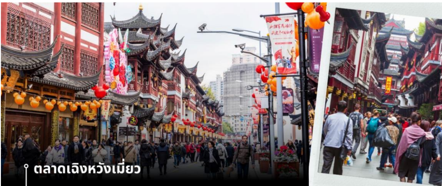
ตลาดเจิงหวังเมี่ยว

นำท่านเดินทางกลับสู่มหานครเซี่ยงไฮ้ โดยใช้เวลาเดินทางประมาณ 2 ชั่วโมง จากนั้นนำท่านชม ตลาดเจิงหวังเมี่ยว หรือเป็นที่รู้จักในชื่อ ตลาด 100 ปี เจินหวังเมี่ยว เมืองเซี่ยงไฮ้ (Chen Wang Miao) ถือว่าเป็นตลาดเก่าของผู้ตั้ง เมืองเซี่ยงไฮ้ อาคารบ้านเรือนบริเวณนี้เป็นสถาปัตยกรรมโบราณสมัยราชวงศ์หมิงและชิง ตกแต่งสไตล์สถาปัตยกรรมแบบโบราณจีน และเก่ากว่าร้อยปี