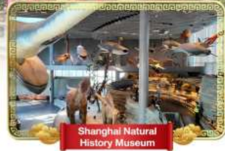
Shanghai Natural History Museum