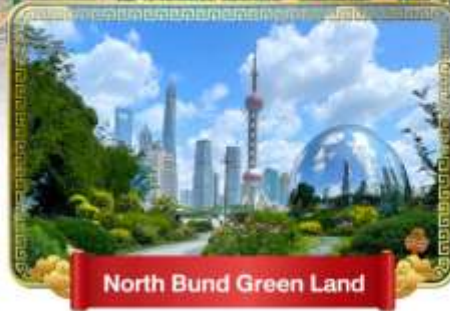
North Bund Green Land