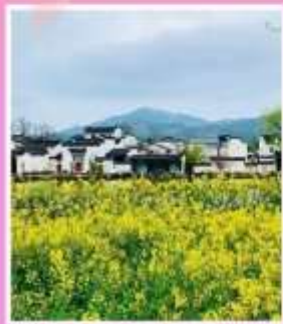
หมู่บ้านโบราณเฉิงชาน