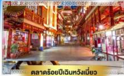
ตลาดร้อยปีเงินหวังเมี่ยว