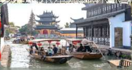
เมืองโบราณจูเจียเจี่ยว