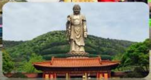
วัดพระใหญ่หลิงซาน

เมนูพิเศษ ซาหมูจูเจียเจี่ยว 5 วัน 3 คืน เดินทาง : 13-17 เมษายน 68 ซีโครงหมูอู๋ซี ซาบูไม้อัน