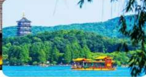
ล่องเรือทะเลสาบซีหู