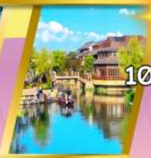
เมืองโบราณผานหลง