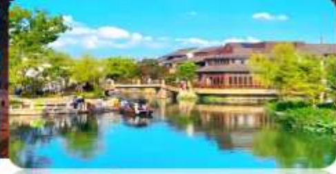
เมืองโบราณผานหลง