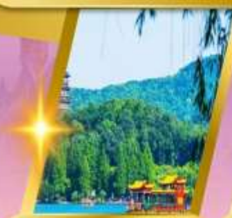
ล่องเรือทะเลสาบซีหู