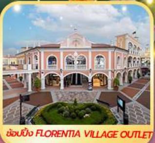
ช้อปปิ้ง FLORENTIA VILLAGE OUTLET