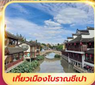
เที่ยวเมืองโบราณซีเปา