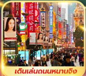
เดินเล่นถนนหนานจิง