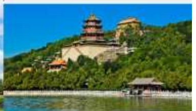
พระราชวังฤดูร้อน

*ทางบริษัทฯ ขอสงวนสิทธิ์ในการสลับโปรแกรมทัวร์ตามความเหมาะสมขึ้นอยู่กับสถานการณ์หน้างาน โดยคำนึงถึงผลประโยชน์ของลูกค้าเป็นสำคัญ