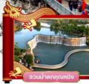
สวนน้ำตกคุนหมิง

✓ พิเศษ! โซลจางอริหม่อง "ความประทับใจลี้เจียง"