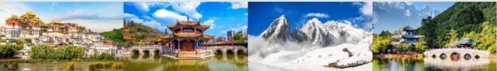
วัดลามะชงจ้านหลิน