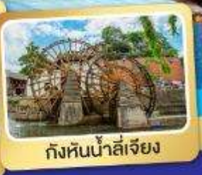
กั๋งหันน้ำลี่เจียง