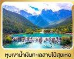
หุบเขาน้ำเงินทะเลสาบไป๋สฺยเหอ