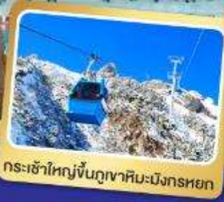
กระเช้าใหญ่ขึ้นภูเขาหิมะมังกรหยก