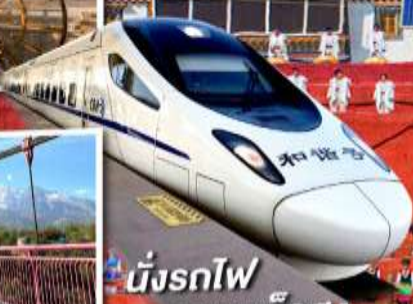
นั่งรถไฟความเร็วสูง