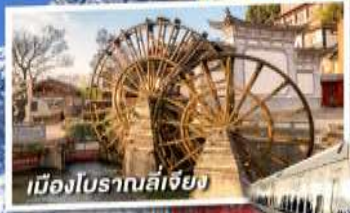
เมืองโบราณลี่เจียง