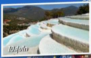
ลี่เจียง