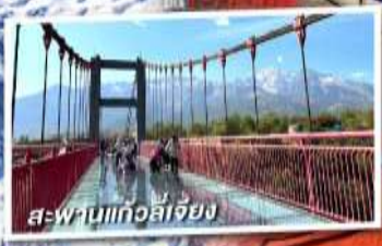
สะพานแก้วลี่เจียง