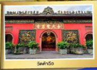
วัดต้าอื่อ