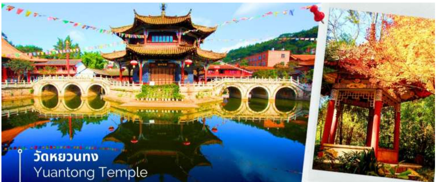
วัดหยวนทง Yuantong Temple

นำท่านชม วัดหยวนทง (Yuantong Temple) วัดแห่งนี้เป็นวัดที่ใหญ่และเก่าแก่ที่สุดในเมืองคุนหมิง สร้างมาตั้งแต่สมัยราชวงศ์ถัง มีอายุยาวนานประมาณ 1,200 กว่าปี การสร้างวัดแห่งนี้จะแปลกตากว่าวัดอื่นในจีน เพราะปกติแล้วการสร้างวัดของจีนส่วนมากจะต้องสร้างอยู่บนภูเขา แต่วัดหยวนทงสร้างวัดต่ำกว่าภูเขา โดยวิหารจะอยู่ต่ำที่สุด เนื่องจากวัดแห่งนี้ไม่ได้สร้างขึ้นเพื่อเป็นวัดโดยตรง แต่เคยเป็นศาลเจ้าแม่กวนอิมมาก่อน