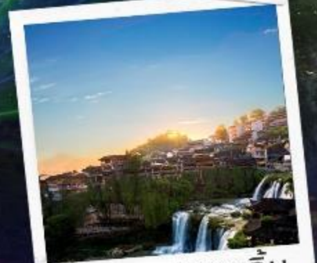
เมืองฟูหลงเจิน