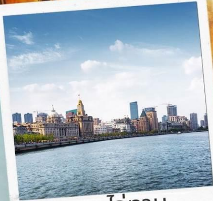
หาดไ่ว่ทาน