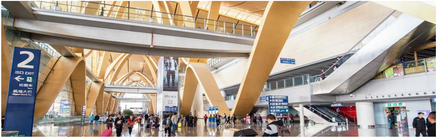
คา รับประทานอาหารค่ำ ณ ภัตตาคาร (มื้อที่ 2)

จากนั้นนำท่านเดินทางสู่ เมืองเซียงหยุน ซึ่งเป็นสถานที่แรกๆ ที่รู้จักกันในนาม "ยูนนาน" นอกจากนี้ยังเป็นศูนย์กลางทางการเมือง เศรษฐกิจ และวัฒนธรรมที่สำคัญทางตะวันตกของมณฑลเอ๋อไห่เลยทีเดียวในอดีต เมืองแห่งราชวงศ์นี้ไม่มีวันอยู่นานกว่า 2,000 ปี