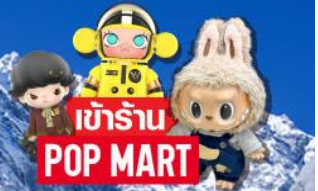
เข้าร้าน POP MART