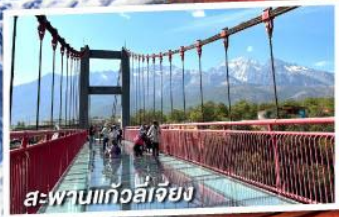
สะพานแก้วลี่เจียง