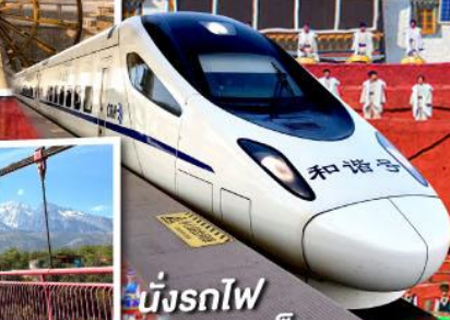
นั่งรถไฟ ความเร็วสูง