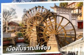
เมืองโบราณลี่เจียง