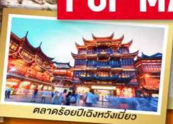
ตลาดร้อยปีอิงหวังเมี่ยว