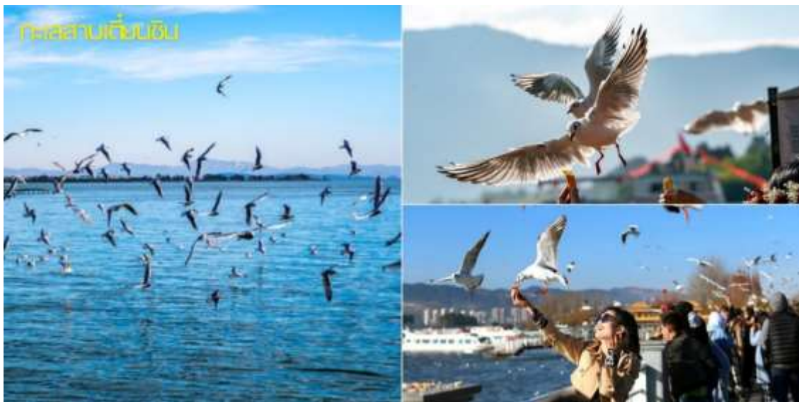
40,000 ตัว ในช่วงฤดูหนาว จากนั้นนำท่านท่านชมสินค้าพื้นเมืองยางพารา

เช้า บริการอาหารเช้า ณ ห้องอาหารของโรงแรม