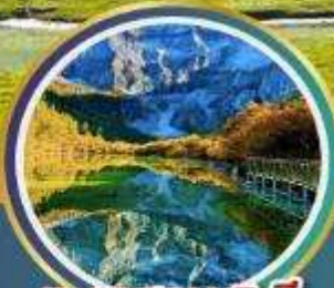
ทะเลสาบ 5 สี