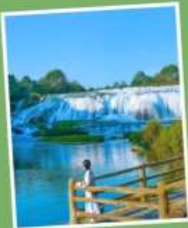
น้ำตกโต้วพัวถาง