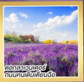
ดอกลาเวนเดอร์ ถนนคนเดินเตียนฉือ