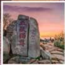
หินแกะสลักในสมัย ราชวงศ์ถัง