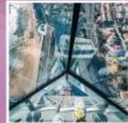
QINGDAO HAITIAN CENTER