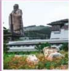
รูปปั้นงจ้อ ที่ใหญ่ที่สุดในโลก