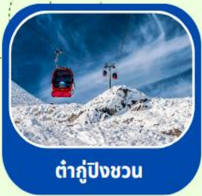
ต้ากู่ปิงชวน

ทัวร์ไม่ลงร้าน+ไม่ขายออฟชั่น+บินFullService