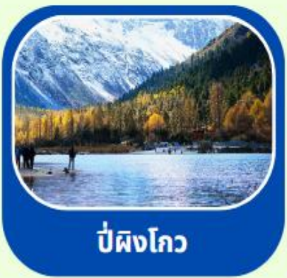
ป่ผิงโกว

เดินทาง : 17-22 พค // 20-25 มิย 8-13 กค 2568