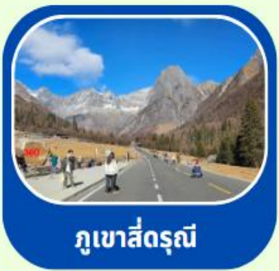
ภูเขาสีดรุณี