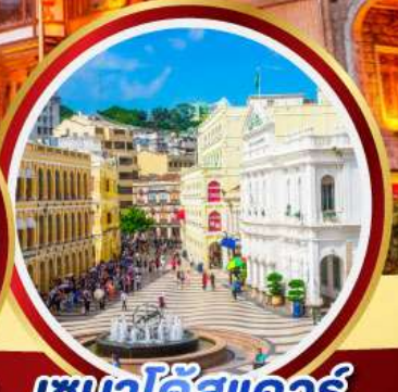
เซนาโดสแควร์