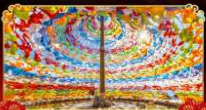
ชมมณฑลยูนนาน