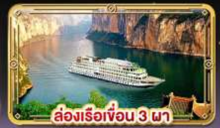
ล่องเรือเขื่อน 3 ภา