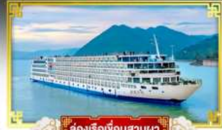
ล่องเรือเขื่อนสามผา