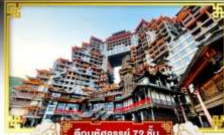
ตึกมหัศจรรย์ 72 ชั้น

• "ประตูสวรรค์" ชมธรรมชาติแห่งจางเจียเจีย