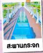
สะพานกระเจก