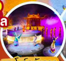
ชมโชว์อสังการ