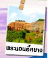
พระนอนอภัย