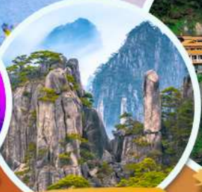
ภูเขาทองชา