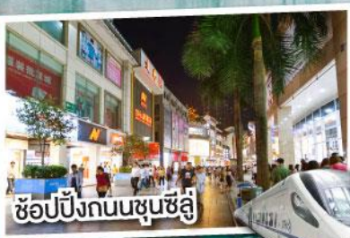
ช้อปปิ้งถนนชุนชี่