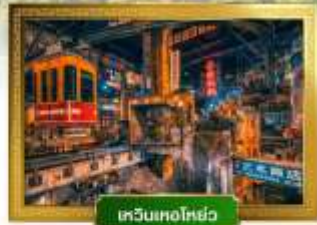
สวนน้ำฟูหลงเจี้ยน

เดินทางโดย : สายการบินโลอันแอร์ อาหาร : 13 มื้อ โรงแรม : 4 ดาว