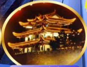
หอคอยทองคำเขียนชัน