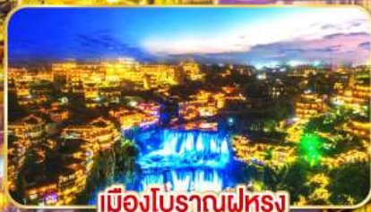
เมืองโบราณฝูหลง