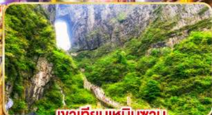
เขาเทียนเหมินซาน