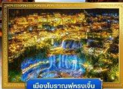
เมืองโบราณฟูหรงเจิ้น