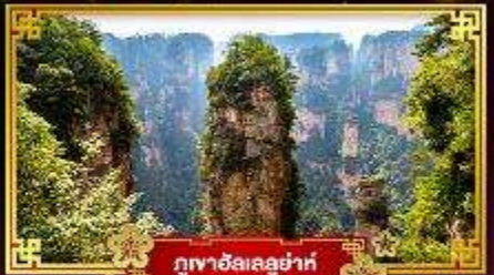
ภูเขาอัลเลลูย่าห์