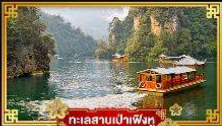
ทะเลสาบเปาฟิ่งหวง