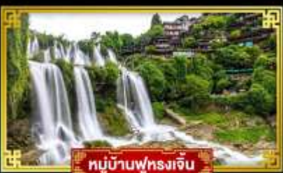
หมู่บ้านฟุทงเจิน