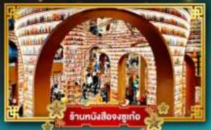
ร้านหนังสือจขงกู่