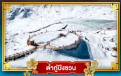
คำกู่ปิงชว่น

สัมผัสความหนาว เที่ยวจัดเต็ม “4 อุทยานสวรรค์”