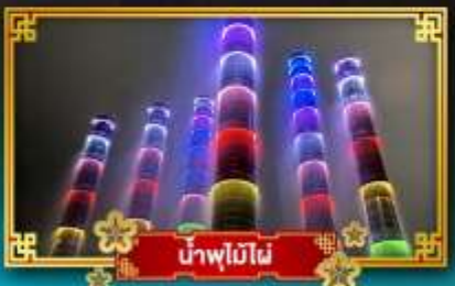
น้ำพุไม๊ผៃ