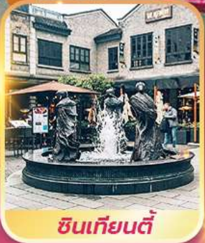
ซินเทียนตี้