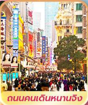
ถนนคนเดินหนานจิง

เดินทาง ก.พ.-มี.ค. 68 18 - 23 ก.พ. 68 25 ก.พ. - 2 มี.ค. 68 4 - 9 มี.ค. 68