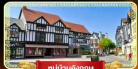
หมู่บ้านอังกฤษ