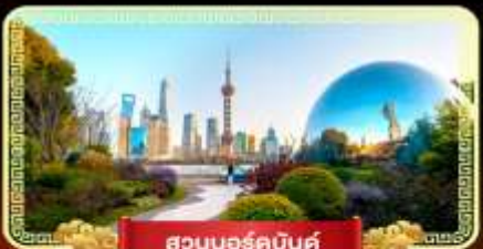
สวนนอร์คบันด์