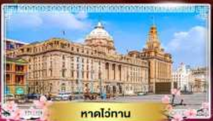
หาดไฉ่ทวน

“ชมดอกซากุระนลิบาน ณ แดนมังกร” ล่องเรือทะเลสาบตะวันตก ไข่มุกแห่งหางโจว