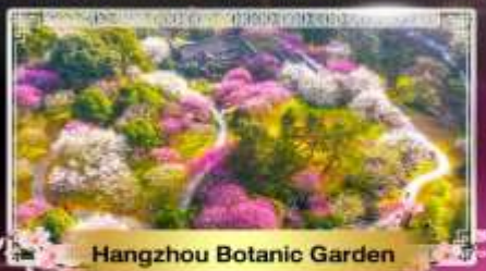
Hangzhou Botanic Garden