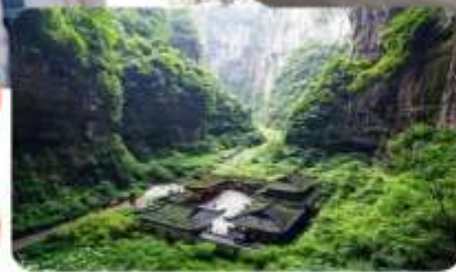
อุทยานหลุมบ่อฟ้า