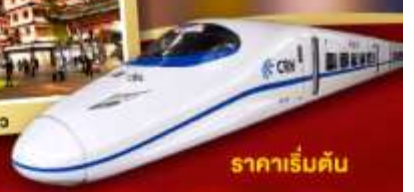
ราคาเริ่มต้น